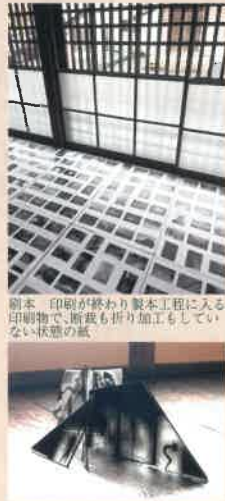
写真用乳剤、ガラス

やおよろず(八百万)とは、「限りないほどの数があること」の意。今、無数のシャッターが切られ、数えきれないほど画像が作られ消去され、瞬時に消費されていく。ここ美濃路起宿脇本陣跡の旧林家住宅、時の堆積を感じる空間で、一瞬を、そして一枚の写真を選んで「見る・見せる事」を考え、展示します。