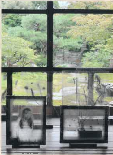
写真用乳剤、ガラス