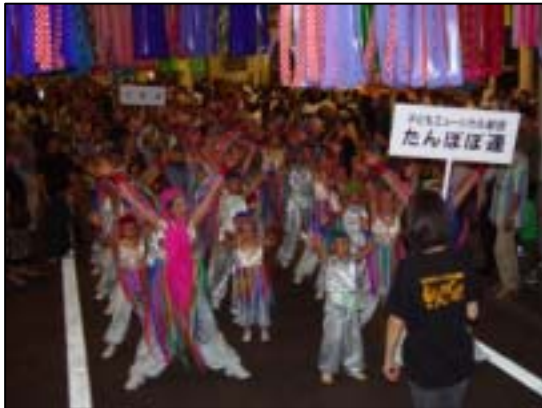
19年度金賞 『子どもミュージカル劇団 たんばんぼ連』

10名以上のチームでワッショーいちのみやの曲に合わせて 自由な振り付け・衣装で踊ろう!! 成績によっては賞がゲットできるかも・・・!?