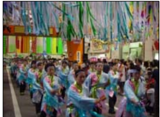
19年度銀賞 『Team みづぼ連』

参加希望の方は、下記申込書にて6月20日(金)までにお申し込みください。詳しくは裏面の参加要項をご覧ください。