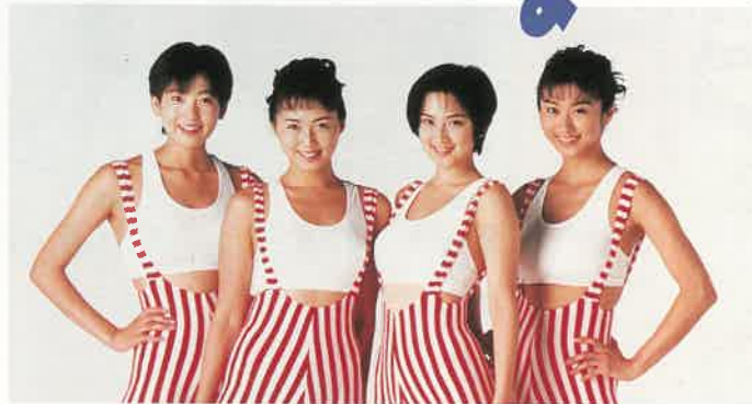
シェイプUpガールズ

●時間/18:00~ ●会場/七夕シアター(JR尾張一宮駅前) '95ミス七夕・ミス織物の紹介ほか [19:10~19:50] ●スペシャルゲスト● [20:00~21:00] パフォーマンスグループ | コンサート POSSEのダンシング | シェイプUpガールズ