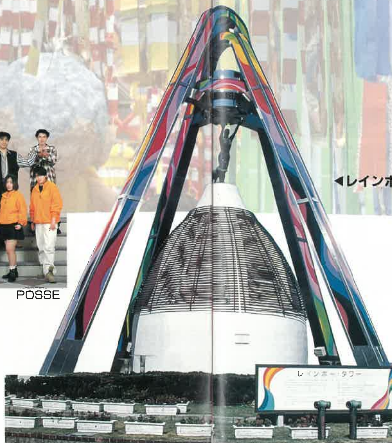
←レインボー・タワー